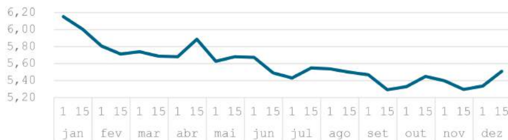
Gráfico 02 - Cotação cambial - Real/dólar

Outro importante indicador ou formador de preço é a valorização cambial. No gráfico 02 observamos que a maior desvalorização da nossa moeda ocorreu em janeiro/25, quando tivemos a cotação de R$6,15/dólar, e a mínima ocorreu em setembro quando registramos R$5,29/dólar.