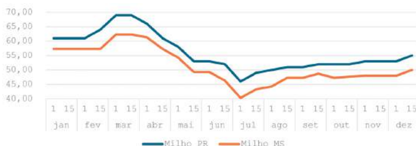
Gráfico 04 - Oscilação dos preços de balcão de milho em Medianeira/PR e Maracaju/MS - R$/sc

No milho, conforme o gráfico 04, as máximas ocorreram em março e as mínimas em julho com cotações de R$69,00/sc e R$62,30/sc no melhor momento e de R$46,00/sc e R$40,30/sc nas mínimas, considerando Medianeira/PR e Maracaju/MS, respectivamente para máximas e mínimas.