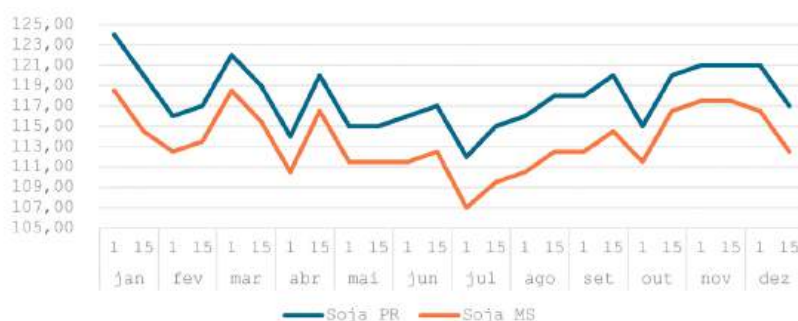
Gráfico 03 - Oscilação dos preços de balcão de soja em Medianeira/PR e Maracaju/MS - R$/sc

Quando olhamos a precificação ao agricultor durante o ano de 2025, vemos que a soja teve seu maior preço de balcão em janeiro/25 e atingiu o valor de R$124,00 por saco em Medianeira/PR e R$118,50 em Maracaju/MS, enquanto os menores preços foram praticados em julho, onde os preços foram de R$112,00 e R$107,00, respectivamente, conforme observado no gráfico 03.