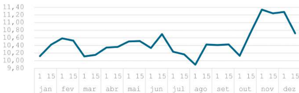
Gráfico 01- Cotação da soja Bolsa de Mercadoria de Chicago - US$/bushel

tes na formação dos preços, na regionalização dos mesmos e na sazonalidade deles. No gráfico 01 temos a variação do preço da soja em Chicago/EUA, na Bolsa de Mercadoria de Chicago (CBOT), que é um dos grandes pilares formadores de preço deste produto para o mundo. Nele podemos ver que as maiores cotações de 2025 ocorreram em novembro (US$11,70/bushel), ou seja, em plena colheita americana, que teve safra normal. O menor preço na bolsa observamos em agosto (US$9,69/bushel), onde historicamente existe forte volatilidade de preço, visto ser o período de definição da safra nos Estados Unidos, ou seja, o tradicional mercado climático, fato não observado este ano.